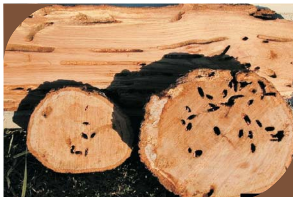
Daños provocados por carcoma grande en roble rojo