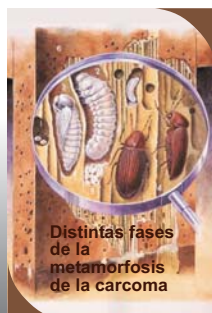
Distintas fases de la metamorfosis de la carcoma