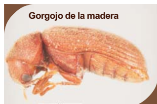
Gorgojo de la madera

Envases de 1, 5, 25, 200 y 1.000 litros.