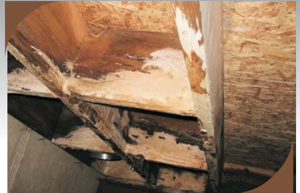
Vigas atacadas por hongos de pudrición blanca

Tras haber sido tratada la madera con RED DEMON SRF como resultado se obtiene una madera protegida contra organismos xilófagos hasta una