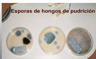
Esporas de hongos de pudrición